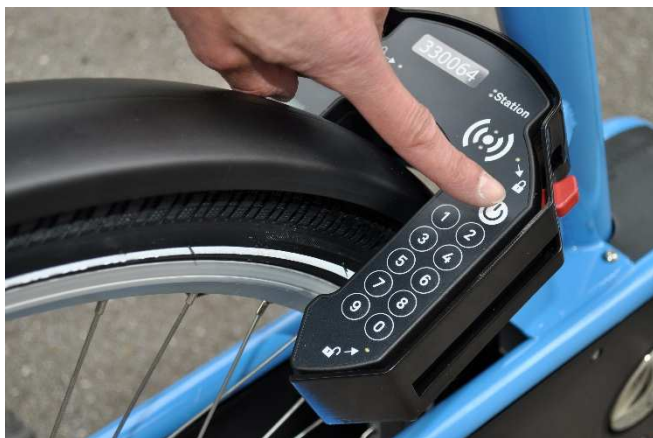
(A) Attivazione del lucchetto

Per noleggiare una bicicletta presso una postazione, premere il pulsante bianco sul dispositivo di blocco elettronico (lucchetto) posizionato sulla ruota posteriore della bicicletta (A).