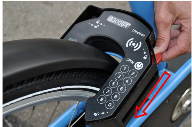
(D) chiusura abbassando la leva rossa