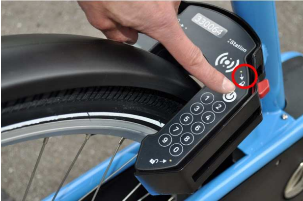
(C) sblocco del lucchetto

Per restituire la bicicletta presa a noleggio, riportarla in una postazione e chiudere correttamente il lucchetto, sbloccando lo stesso dapprima attraverso il pulsante bianco (C) ed in seguito abbassare la levetta rossa situata sulla destra (D). Quando la spia bianca munita di icona con lucchetto lampeggia, la bicicletta può considerarsi bloccata.