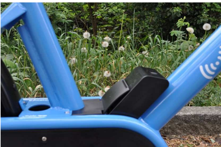
(E) Inserimento batteria personale

Per beneficiare dell'aiuto alla pedalata tramite la batteria personale, è sufficiente inserirla nello spazio previsto per questo scopo (E) e assicurarsi che il suo stato di carica sia sufficiente. Il pulsante situato sulla batteria permette di verificarne lo stato di carica attraverso l'indicazione luminosa.